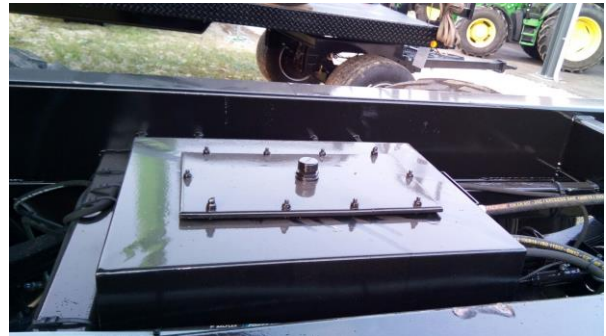
Pompe hydraulique auxiliaire