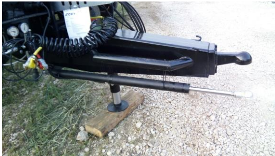
Essieux forcé hydraulique