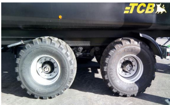
Suspensions avec 1800mm entre essieux (PTAC + 2 tonnes)