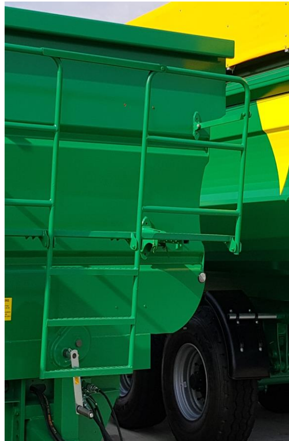
Balcon avant pliable