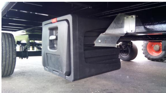
Caisse à outils